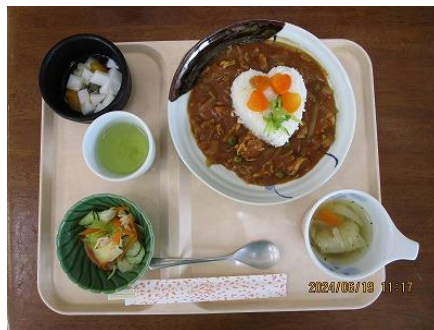
愛のブーケハヤシライス