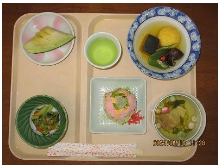
ウェディングケーキ寿司