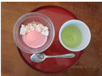
ストロベリー アイスクリーム